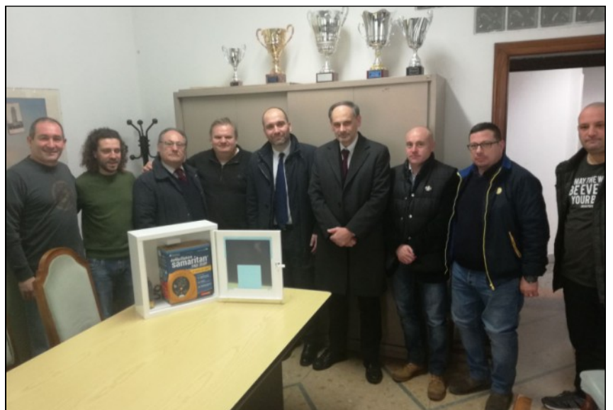
Sotto un momento della consegna del defibrillatore alla U.I.C.