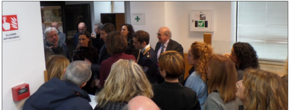
Alcuni momenti dell'inaugurazione della zona cardio protetta di via Cavour a Roma

E'importante frequentare i corsi di Primo soccorso e Defibrillazione per acquisire tecniche utili in caso di necessità. Tra queste importantissima è la manovra di Heimlich per rimuovere un'ostruzione delle vie aeree.