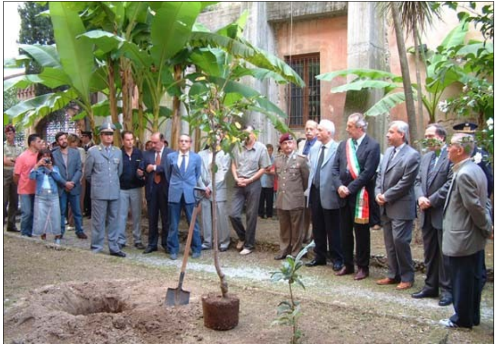
Sopra una Cerimonia A.D.M.I. nell'Ufficio Territoriale del Governo - Prefettura di Pisa

L'operazione è stata portata a termine grazie all'instancabile operato dell' Assofly ONLUS gemellata A.D.M.I.