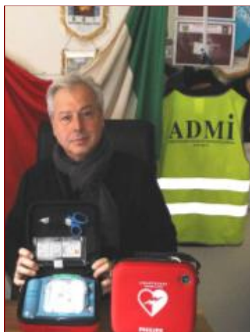
Sopra i defibrillatori appena acquisiti dall'Associazione Dipendenti Ministero dell'Interno and partners

Intanto, dopo il convegno svolto dall'A.D.M.I. nel salone delle conferenze, individuata la possibile postazione del primo defibrillatore messo a disposizione dell'Amministrazione dall'A.D.M.I. per eventuali emergenze al palazzo Viminale.